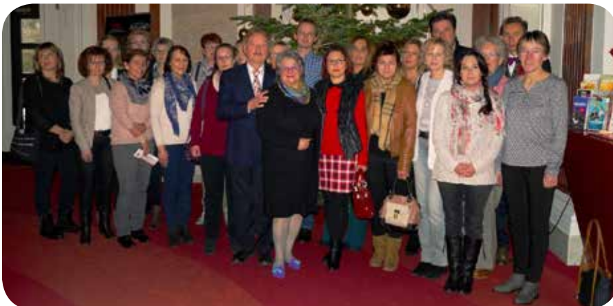
Herzliche Grüße Ihr K&K Pflorgeteam

Wir wünschen unseren Pflegekunden, ihren Familien und den Lesern alles Gute, Gesundheit und einen schönen Start in den Frühling.